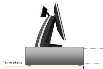
auf dem Tisch