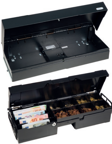
Außenkassette und bestückte Innenkassette