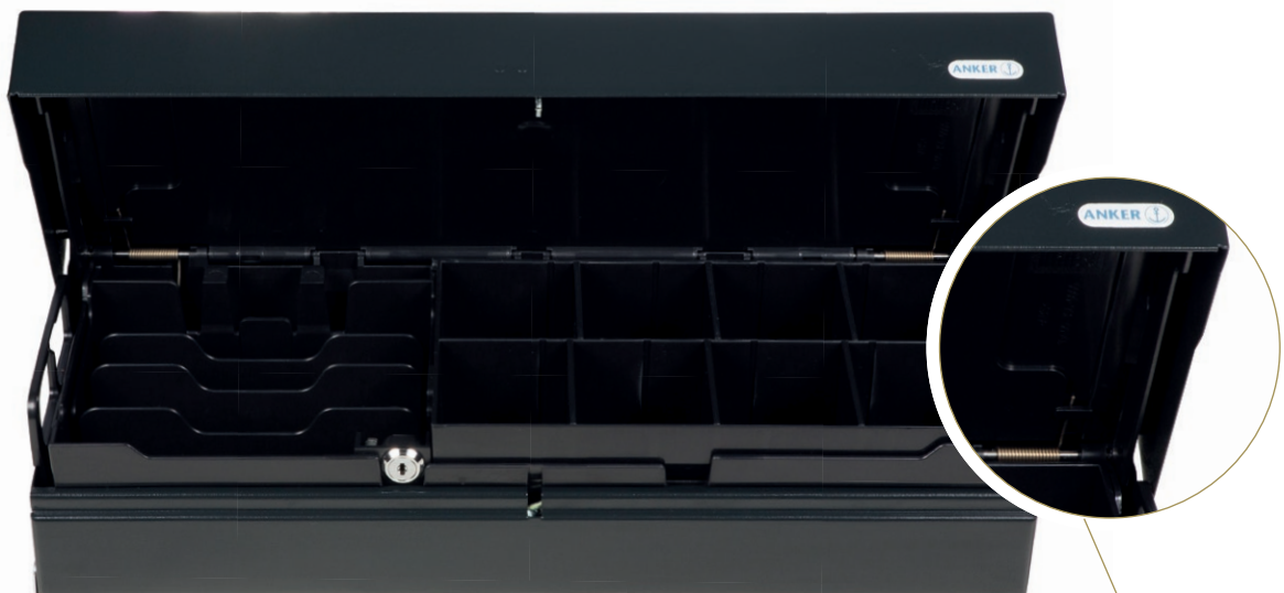
Innenkassette mit Deckel

› Servicefreundlich durch abnehmbares Kabel